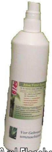
250 ml Flasche

Aloe Vera Gel zu min. 78 %, Allantoin, Bienen Propolis, Extrakte aus Ringelblume, Scharfgarbe, Thymian, Kamille, Löwenzahn, Eukalyptus, Passionsblume, Salbei, Ingwer, Borretsch, Sandelholz.